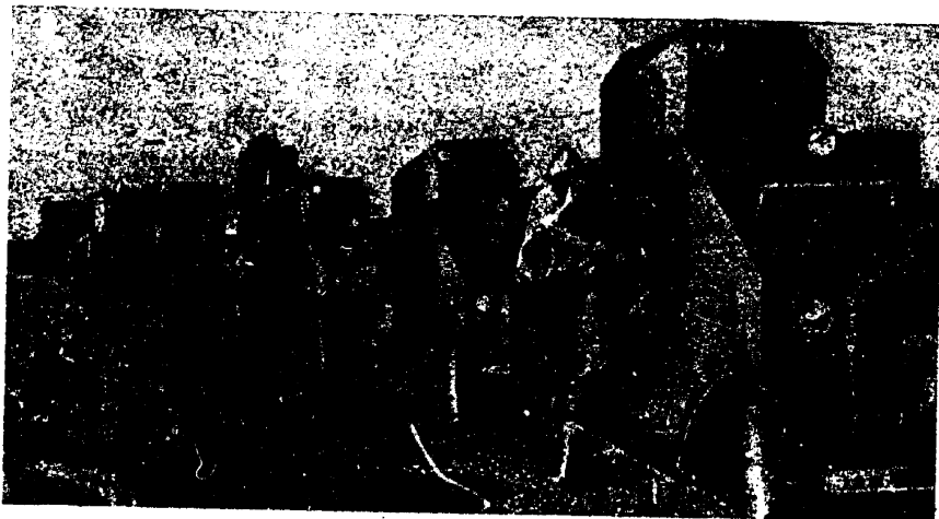
א דיוויזאָן ענגלישע טאנקן אין שאנכאי

כינע רעכנט זיך פאר א זעלבשמענדיקע מעלוכע. זי האט זיך איר רעגירונג. אט פארוואס מען קאן ניט זאגן גלייך, אז כינע איז א פאשעטע קאלאניע. אבער דאס דוכט זיך נאר אויס, אז כינע איז